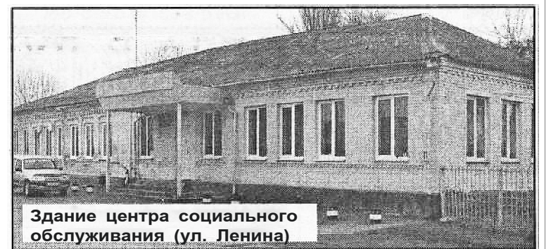
Здание центра социального обслуживания (ул. Ленина)